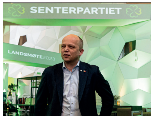
NEI: Sp-leder Trygve Slagsvold Vedum sier blankt nei til å åpne døra og ta SV inn i regjering, til tross for SVs linjeskifte i Nato-politikken.

– Vi har også måttet ruste opp vårt eget forsvar. Jeg er helt sikker på at en regjering med Senterpartiet og Arbeiderpartiet har gjort oss mer styringsdyktig i denne tiden, sier Sp-lederen og finansministeren.