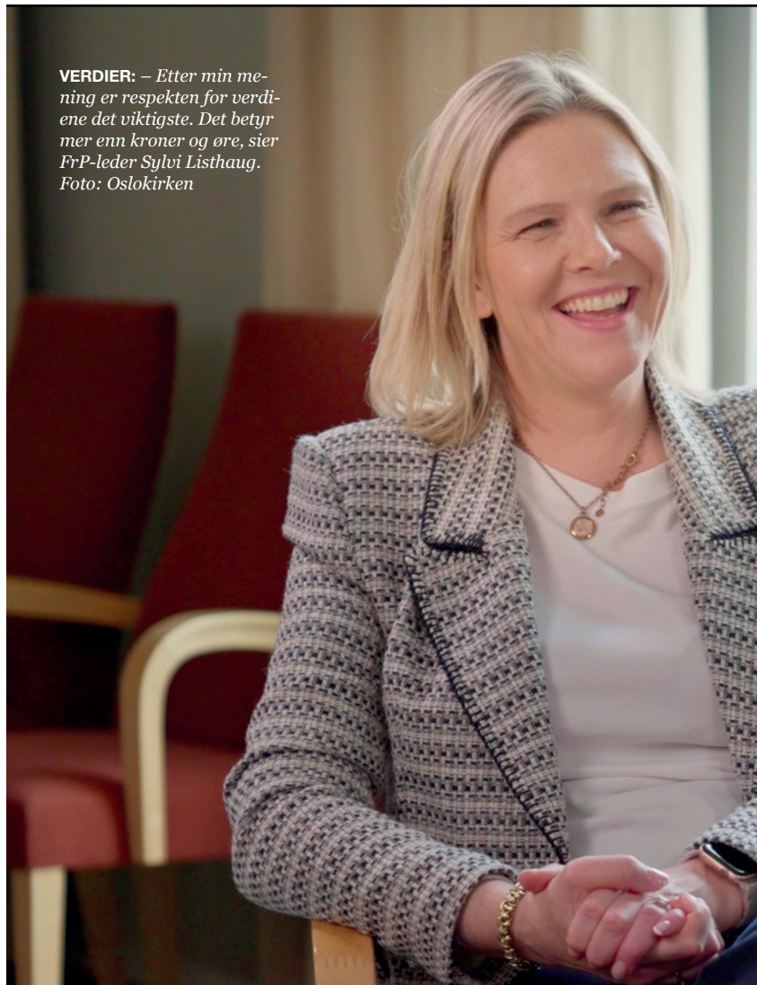
VERDIER: – Etter min mening er respekten for verdiene det viktigste. Det betyr mer enn kroner og øre, sier FrP-leder Sylvi Listhaug.

– Derfor sier vi også at det viktigste er frihet for familien til å kunne bestemme over seg selv og sitt virke,