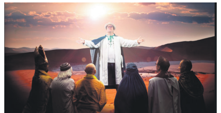
Faksimile fra NRKs nettside om «På tro og Are»

Sannheten fortalte Aftenposten og Der Spiegel. Trump står sterkere i partiet og kan bli gjenvalgt, sa Aftenposten. Der Spiegel skrev og motsatt av NRK: Kritikerne faller ut av partiet, ikke Trump. La oss få slippe så mye dramatiske fake news på USA – og Israel (om okkupasjon etc). La oss få litt flerkildjournalistikk , så unngår det norske folk å bli demagogisk lurt av fake news-presentasjoner. Balanse er viktig om man skal forsvare penger fra samfunnet på 5,7 milliarder i året.