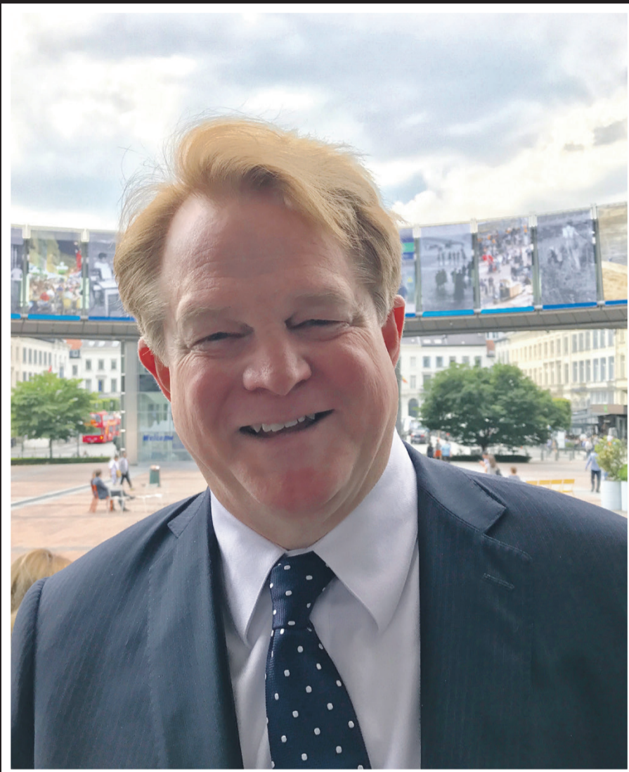
FILM OM JERUSALEM: Gordon Roberston, konsernsjef i CBN dokumenterer hva som skjedd i Jerusalem for 50 år siden.